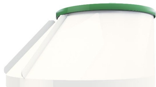
Anlegget kan leveres med konisk hals.